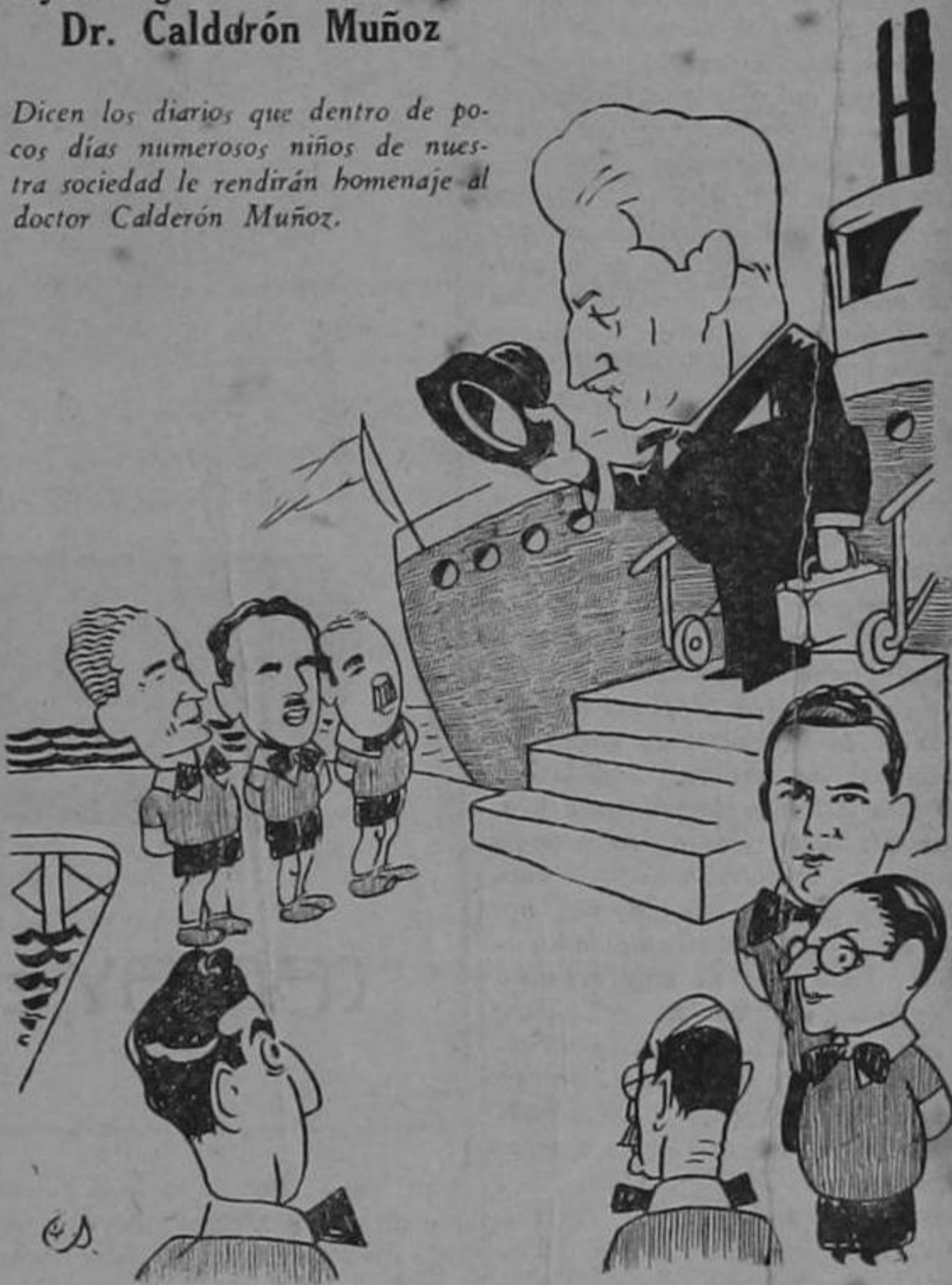
Pero el kinder del gabinete se les adelantó...