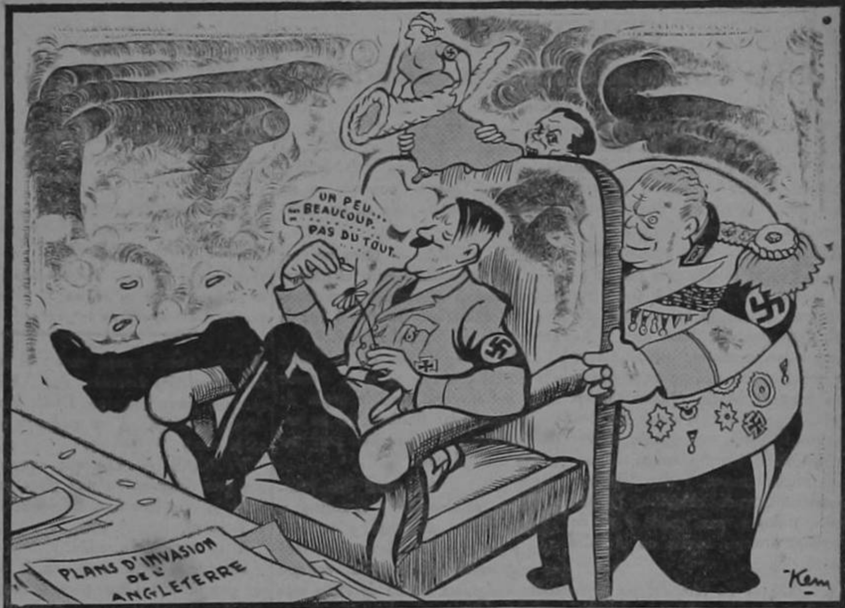
A este también le ocurre la del gallo enano.

tejar significa cortejar, obsequiar. Festejar es galantear o requebrar a una mujer. En los clásicos encontramos que "festejo" significa galanteo, requiebro, lisonja para ganar el amor de una mujer.